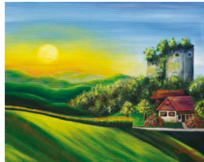
Mojca Sivka, Jutro nad Rifnikom