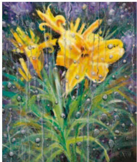
Ivo Brodej, Po dežju