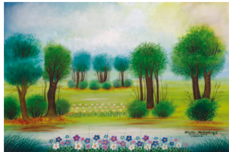
Zlatko Kolarek, Ob vodi