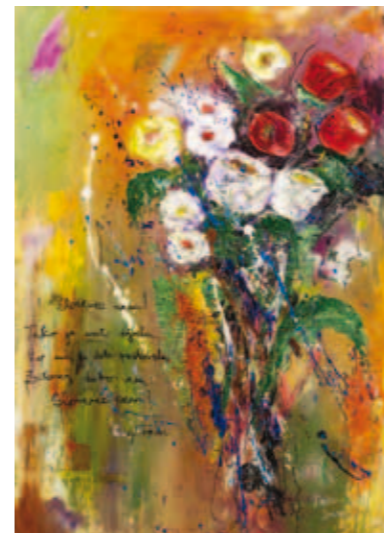
Zvonko Živčec, Ipavčeve vrtnice