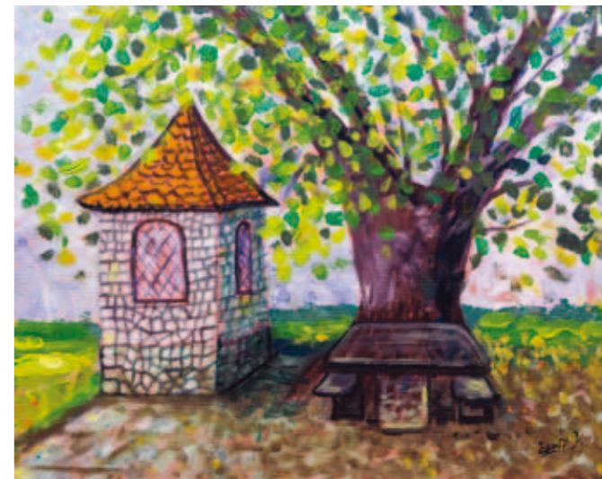
Štefka Kumer, Pod lipo