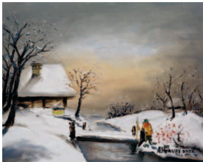
Alojz Horvat, Spomini na zimo