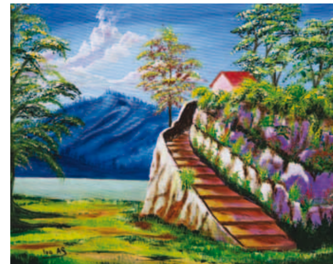
Ivo As, Hiša ob jezeru