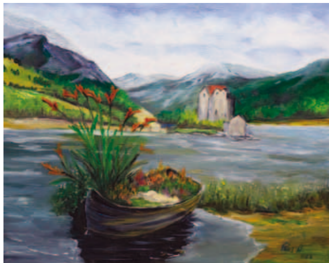
Dobra Vein, Ob jezeru