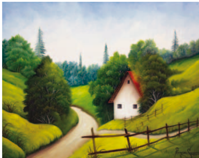
Stjepan Pongrac, Moj dom